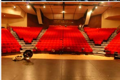
Salle Coppélia (643 places) après travaux et banque d'accueil